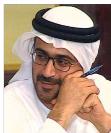
الدكتور جمال سند السويدي