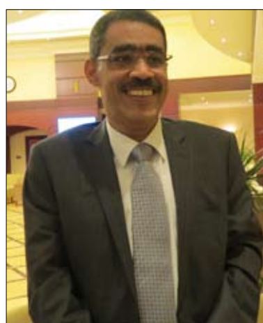
الدكتور ضياء رشوان