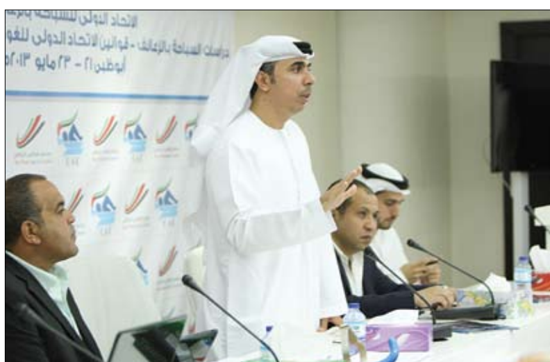
دور المشاركين والمشاركات الذي كان لهم الأثر البارز في تحقيق علامات النجاح لحاور الدورة.

أكد الفريق أول سمو الشيخ محمد بن زايد آل نهيان ولي عهد أبوظبي نائب القائد الأعلى للقوات المسلحة ان دولة الإمارات العربية المتحدة لن تدخر جهداً في دعم الأنشطة والفعاليات الرياضية التي تساهم في رفع اسم الإمارات عالياً في المحافل الرياضية الإقليمية والدولية. وأكد سموه ان اهتمام صاحب السمو الشيخ خليفة بن زايد آل نهيان رئيس الدولة حفظه الله ودعمه للرياضة والرياضيين حقق إنجازات ومكتسبات مهمة على الساحة الرياضية وأسهم في تعزيز وتطوير المجالات الرياضية وحقق لها مزيداً من التقدم والريادة مع باقي القطاعات الحيوية في الدولة مشيراً سموه الى حرص صاحب السمو رئيس الدولة الدائم على الالتقاء بأبنائه اللاعبين ودعمهم ومساندتهم في كافة المناسبات الرياضية وتهنئتهم بما يحققونه من انتصارات وإنجازات. جاء ذلك خلال استقبال سمو الشيخ محمد بن زايد آل نهيان بعد ظهر امس بقصر البحر في أبوظبي.. بحضور سمو الشيخ حمدان بن زايد آل نهيان ممثل الحاكم في المنطقة الغربية.. الفريق سمو الشيخ سيف