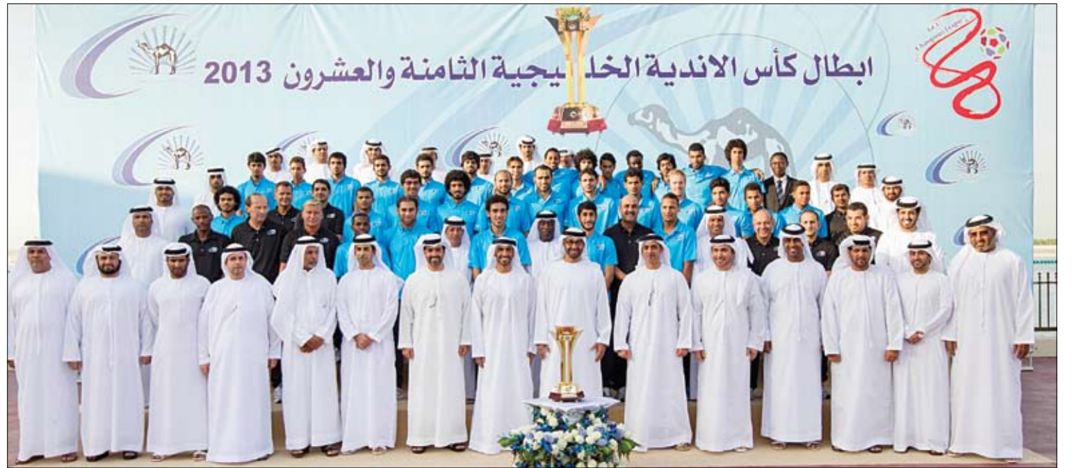
استقبل نادي بني ياس بطل كأس الأندية الخليجية