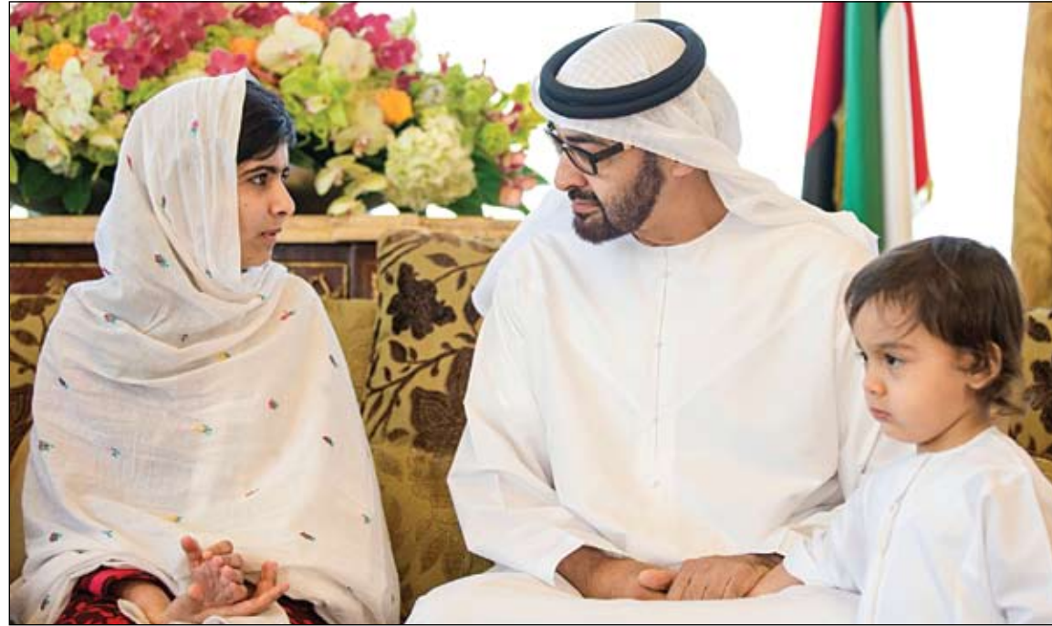
محمد بن زايد خلال استقباله الفتاة الباكستانية مالالا في لفظة إنسانية للأطمئنان على صحتها

حمدان بن زايد: المنطقة الغربية تحظى باهتمام بالغ من قيادتنا •• أبوظبي-وام: أكد سمو الشيخ حمدان بن زايد آل نهيان ممثل الحاكم في المنطقة الغربية ان المنطقة الغربية تحظى باهتمام بالغ من قبل صاحب السمو الشيخ خليفة بن زايد آل نهيان رئيس الدولة حفظه الله والفريق أول سمو الشيخ محمد بن زايد آل نهيان ولي عهد أبوظبي نائب القائد الأعلى للقوات المسلحة رئيس المجلس التنفيذي لإمارة أبوظبي كامتداد لنهج المغفور له بإذن الله الشيخ زايد بن سلطان آل نهيان طيب الله ثراه والذي تحدى المستحيل وتمكن من تحويل جفاف الصحراء إلى أيقونة خضراء نقيضاً في ظلها الجميع. (التفاصيل ص2) تناولت (الفجر) هنر استهلاكها منذ شهر ونصف الشهر التربية تستجيب وتضع ضوابط للحد من الاستهلاك الامعقول للمياه والكهرباء بالمدارس •• دبي - محسن راشد انتهت وزارة التربية والتعليم مؤخراً، من وضع ضوابط من شأنها الحد من ظاهرة الهدار في استخدام المياه والكهرباء بعدد كبير من مدارس الدولة، حتى باتت ظاهرة أدت إلى تفاقم قيمة الاستهلاك لتلك المدارس خلال الفترة الماضية، حيث بلغت قيمة بعض الفواتير أكثر من 400 ألف درهم في فترة الصيف لمدارس بلا طلاب ولا معلمين، وكانت جريدة الفجر قد تناولت هذا الهدر بالنشر الخميس 11 أبريل الماضي تحت عنوان (بعد - سيات - دام أكثر من عامين.. التربية تطالب مناطقها بموافاتها بمصر عدادات المياه والكهرباء بالميدان التربوي). واستهلاك يفوق المعقول في عطلة الصيف تصل لأكثر من 400 ألف بمدارس بلا طلاب ومعلمين..... وعامل النظافة يستخدمون - خراطيم الإطفاء - في