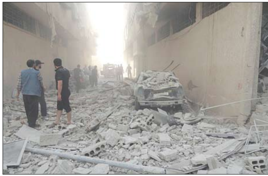
شبان سوريون يعاينون احد احياء العاصمة دمشق عقب قصفه من قبل القوات النظامية

تعرض لقصف عنيف بقذائف الديبابات والمدفعية. وفي بروكسل حاول وزراء الخارجية الأوروبيون التوصل الاثنين الى تسوية صعبة بشأن خلاف وانقسام حول تسليح مقاتلي المعارضة في سوريا عندما ينتهي الحظر على الاسلحة الممول به في نهاية الاسبوع. وتمارس بريطانيا ضغوطاً تستهدف رفع الحظر الذي يفرضه الاتحاد الأوروبي على الاسلحة على سوريا من أجل وصول إمدادات السلاح لقوات المعارضة المعتدلة. من جانبها أعربت نايف بيلاي المفوضة السامية لحقوق الانسان بالامم المتحدة عن فرغها من الانتهاكات المروعة لحقوق الانسان في سوريا والتي أصبحت تقابل بتجاهل صارخ للقانون الدولي. وقالت بيلاي في كلمة لها في افتتاح الدورة الجديدة لمجلس حقوق الانسان بجنيف إن أشكالاً من العنف غير عنيف تصاعدت لتتحول إلى حرب وحشية تغذيها الأطراف الخارجية ويتحمل المدنيون فيها العبء الأكبر.