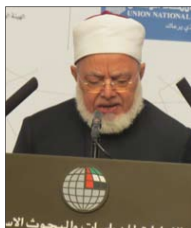
الشيخ محمد الأحمدى